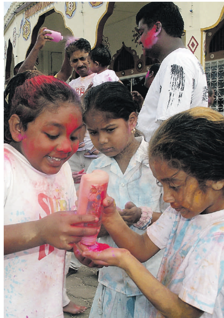
Hindoestaanse meisjes in Suriname vieren het Holi-feest.

Hindoestanen in Nederland zijn afstammelingen van de ruim 34.000 Brits-Indische contractarbeiders die vanaf 1873 naar Suriname migreerden. Na de afschaffing van de slavernij was er een dringend tekort aan arbeidskrachten op de plantages. Nederland tekende met de Brits-Indische regering een immigratietraakt. De contractarbeiders moesten inderdaad bijzonder hard werken onder slechte en soms schrijnende