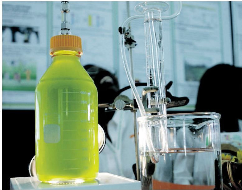
Algen in een potje, nog een lange weg naar biobrandstof.

De desastreuze effecten van biobrandstoffen op ecosystemen (palmolie) en de wereldvoedselmarkt (maïs) leidden tot grote maatschappelijke weerstand, denk aan de voedselrellen in Mexico. Bovendien gaat door grootschalige boskap de productie van de eerste generatie biobrandstoffen uiteindelijk met meer